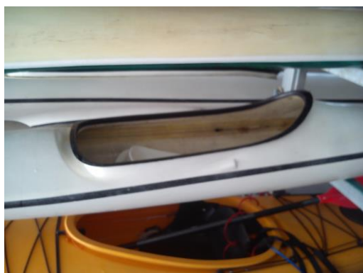
Piragua mal colocada

Las piraguas entrarán y se colocarán en su estantes con la proa hacia el exterior , de forma que la popa quede siempre en la parte más interior del hangar, y se colocará de tal forma que la proa no golpee con la puerta de la nave cuando esta se cierre. De esta forma, las matrículas serán visibles desde el exterior y los timones estarán siempre en el interior, evitando así posibles enganches.