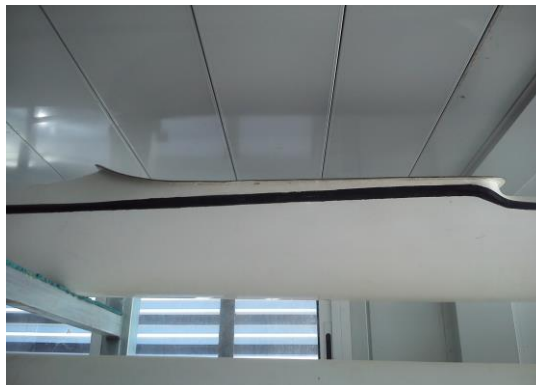
Piragua mal colocada

La bañera hacia arriba hace que se acumule el agua residual en el interior, causando manchas y mal olor.